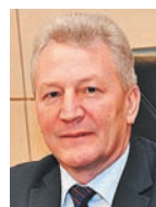
А.В. БАЛАНДИН, министр строительства Самарской области:

- Наша главная задача — привести программу развития жилищного строительства Самарской области в соответствие с региональным бюджетом. В рамках программы на три года предусмотрено дополнительное финансирование в размере 5,25 млрд рублей из федерального и регионального бюджетов.